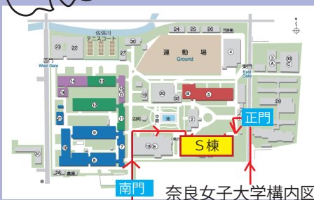
奈良女子大学構内図