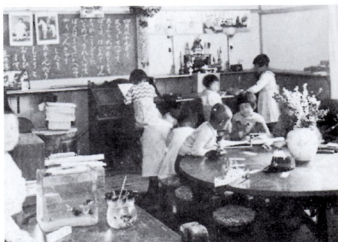
合科学習 (おもちゃづくり)