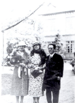
ヘレンケラー女史 (左) 1937年 (昭和12年) 5.11