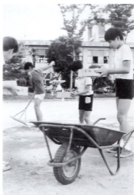
なかよし (運動場グループ)