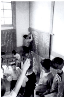
なかよし (なかよし委員会)