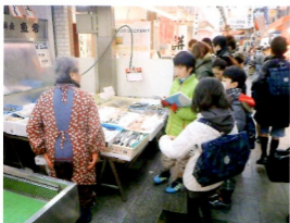
しごと (鮮魚店へのインタビュー)