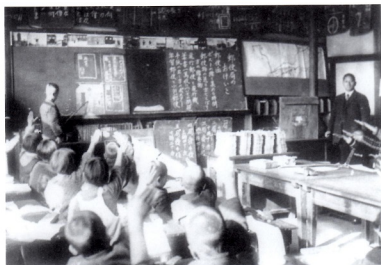
合科学習 (ゆうびん局)