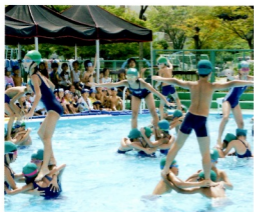
プール水泳納めの会