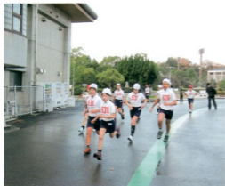
歩走練習 (鴻池陸上競技場)