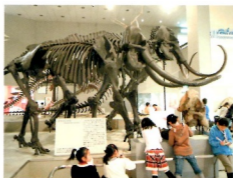
しごと (恐竜博物館見学)