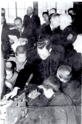
米国第一次教育使節団 1946年 (昭和21年) 3.17