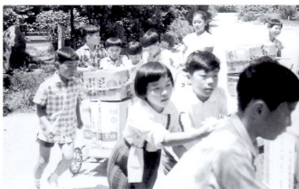
なかよし (青少年赤十字活動～災害地への見舞品発送～)