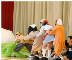
低学年なかよし集会 (げき「大きなかぶ」)